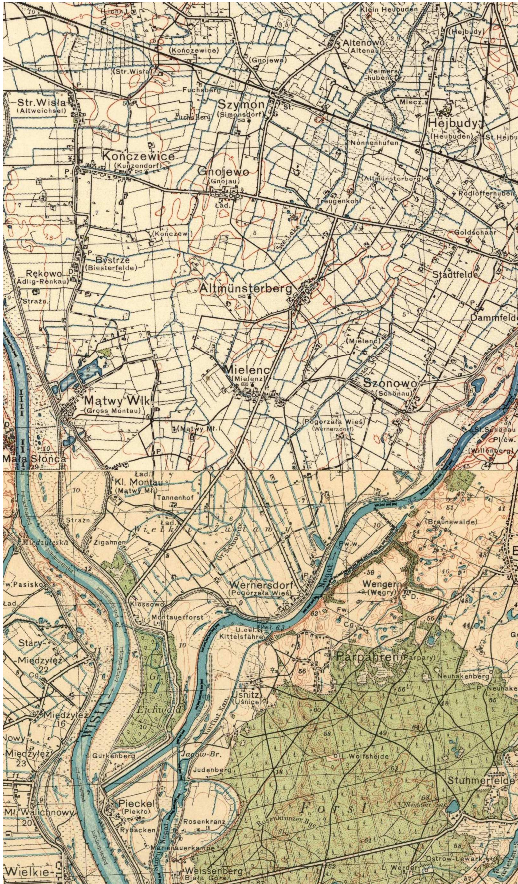
Okolice Międzyrzecza na przedwojennej polskiej mapie wojskowej