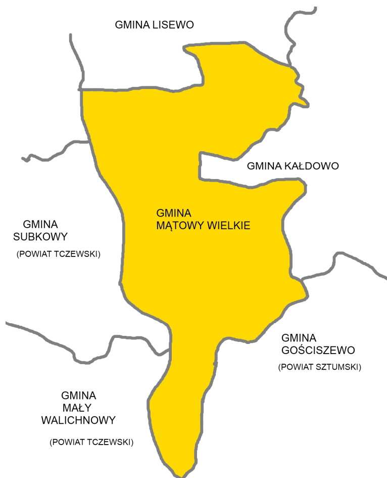
Podział na gminy w okresie powojennym (opracowanie własne)

Gminy podzielone były na nadal na gromady (odpowiednik współczesnych sołectw).