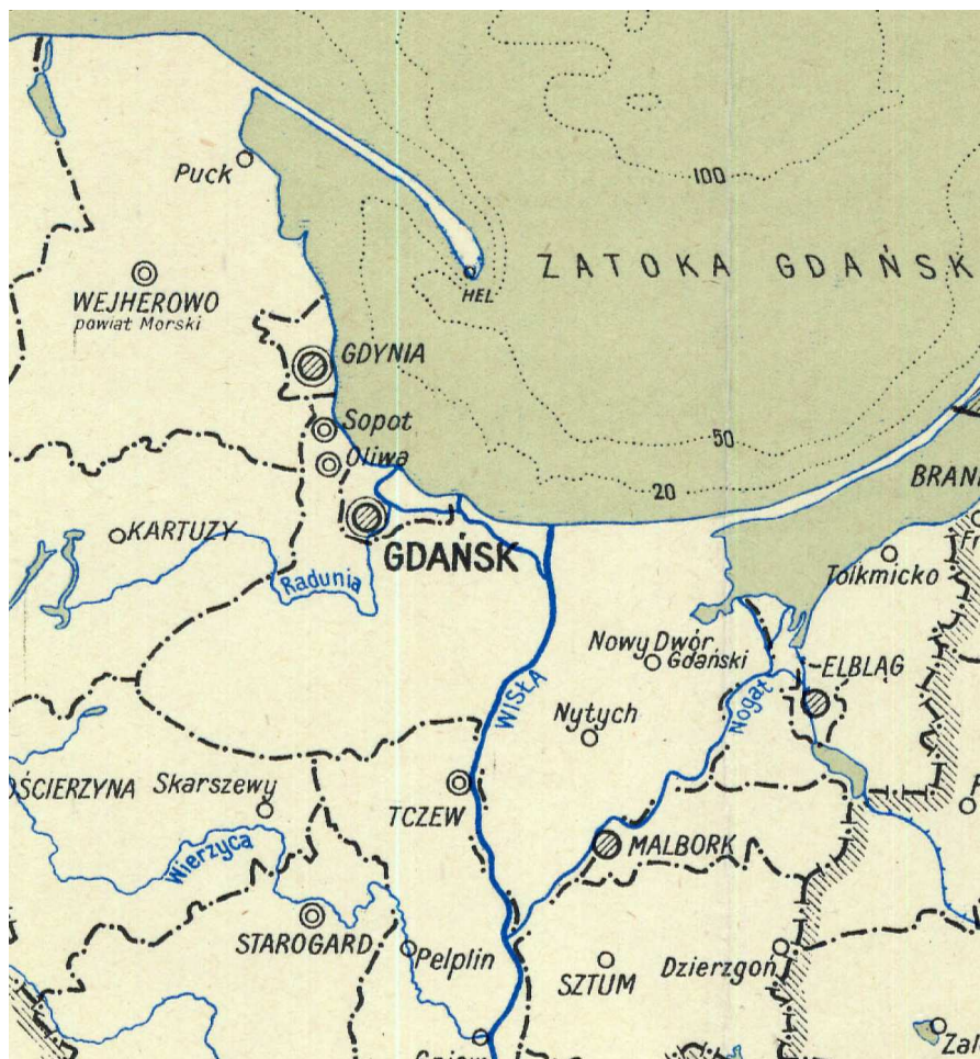
Fragm. administracyjnej mapy z 1946 roku.

Nowe gminy objęły normy prawne z 1933 roku oraz zmiany z lat 1944-1945, które obowiązywały w reszcie kraju. W tym miejscu należy opisać ustrój miast i gmin funkcjonujący w Polsce przedwojennej od 1933 roku (tak zwanej „scaleniowej”). 13